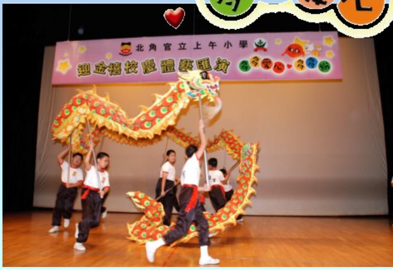
同學們舞動愛心龍 為匯演揭開序幕。