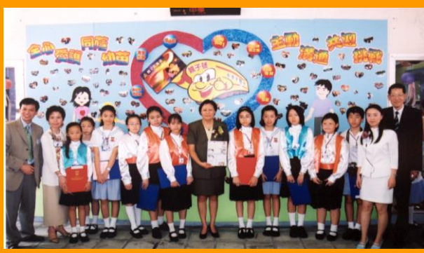
范主席手持學生報與何校長跟一眾小記者合影。

【本報訊】「嘉賓來了！嘉賓來了！范主席來了！」隨著大家的歡呼聲，立法會主席范徐麗泰太平紳士徐徐地走進我校了。她那和藹的眼神，就像給小記們吃了一顆定心丸，機不可失，一會兒