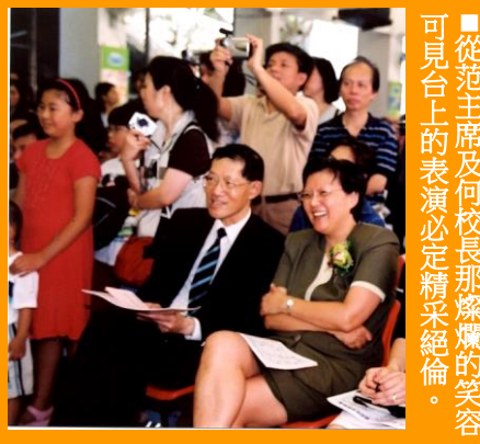
從范主席及何校長那燦爛的笑容可見台上的表演必定精彩絕倫。

到場作主禮嘉賓，欣賞同學們的精彩表演，著實難得。 首先，范主席在何校長和家教會主席王慧齡女士的陪同下，一起主持了金龍點睛儀式，儀式端重而嚴肅。接著，由家教會主席致和范徐麗泰太平紳士分別致辭，而由范主席主持的「網上互動天地」啟動儀式就揭開是次開放日的序幕了。 緊接著是全校的體藝活動大展觀。禮堂裏，嘩，節目多姿多采，豐富之極。有中樂團表演的龍舞、鳳陽花鼓舞和金蛇狂舞，那優美的旋律不斷高低起伏，令人陶醉……由一、二、三年級表演的舞蹈是「大西瓜」舞。唱遊表演的「愛惜生命」，舞姿美妙動人；由中、高年級表演的每一首大合唱也一樣扣人心弦……觀眾席上座無虛席，眾嘉賓的掌聲更是此起彼落。除了表演的人努力外，同時，一些小講解員也很細心地為來賓們講解展板上內容。大家都使出渾身解數，力求做到盡善盡美，為學校添一份光彩。 「創意天地任縱橫」是本年度開放日的主題。顧名思義，這次開放日展出的全都是同學們的創意作品。你看，當你一踏進北官的校門，眼前便是一塊內容豐富、色彩鮮艷的壁報板，上面寫著：「創意天地任縱橫」，你可以盡情一睹同學們那一份份濃濃的創意精神。 此外，今年學校為了讓學生表演時美觀和醒目些，由家長及學生精心設計了些漂亮的團服，不同的組別都有不同服飾，真是讓人眼前一亮。 【本報訊】二零零二年六月一日是本校的開放日，我校有幸邀請到立法會主席范徐麗泰太平紳士