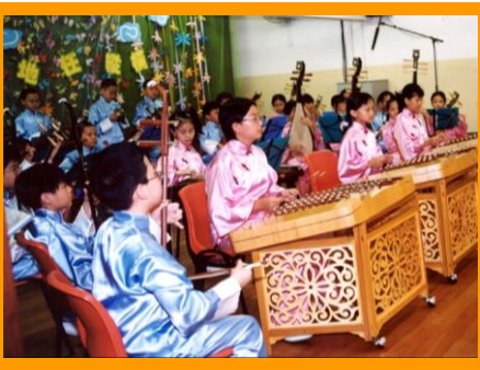
中樂團團員穿上色彩鮮明的團服，加上悠揚的樂聲，可謂極盡視聽之娛！