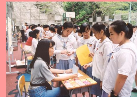
“Please choose a card. Let's play.”

Reported by Lau I-teng(6A) & Chan Tin-yau(5A).