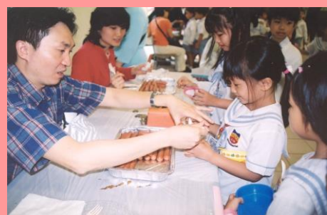
“Can I have a sausage, please?”

parents came and helped to carry out the activities. I think all of our students enjoyed the day very much.