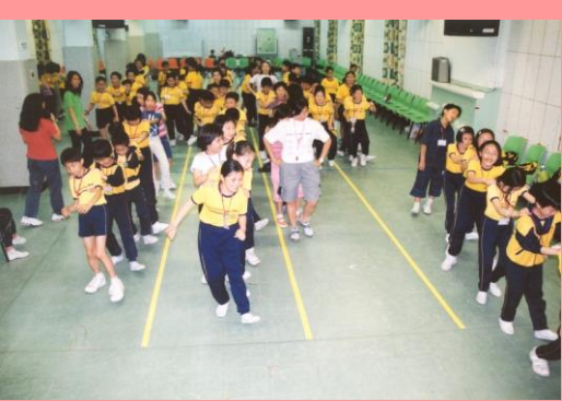
看學生跳土風舞多投入!

【本報訊】我今年度的戶外教育營已於四月十五日至十九日舉行，目的地是柴灣鯉魚門度假村。它位於港島東半山，佔地很廣，營地的設施包羅萬有，有籃球場、排球場、繩網、卡拉OK等等，難怪同學們都玩得興高采烈，樂而忘返。四月十五日下午一時多，四年級的同學在學校二樓有蓋操場集合，大家整裝待發，由於參加的同學有一百位，所以場面十分熱鬧。在老師的帶領下，我們乘搭校車進營地。在車廂裏，每人都流露出愉快而又緊張的神情，因為大多數同學都是第一次獨自離家到別的地方住宿。