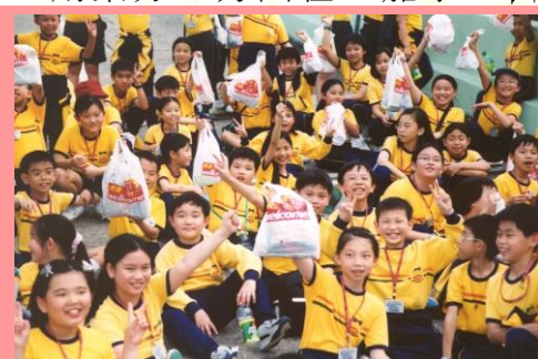
不是廣告白呀！而是學生經過一番努力從超級市場買回來的食物，難怪他們都雀躍萬分。