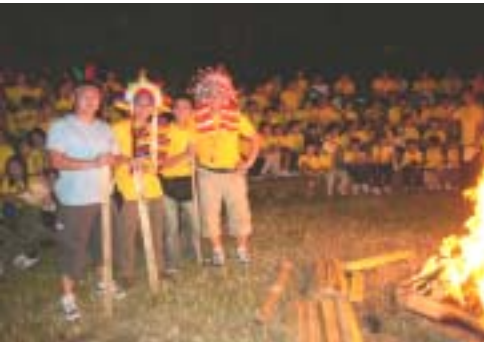
野人來了！家長和老師的扮相多有趣！