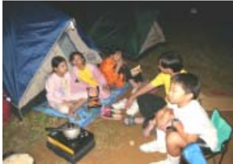
第一次紮營，第一次睡帳幕，真好玩！