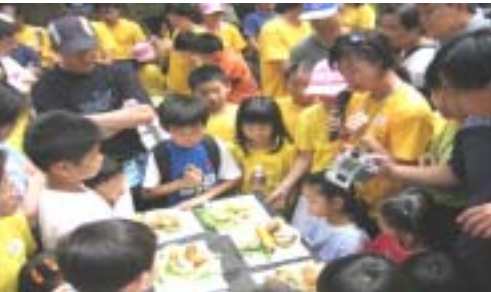
看看誰煮出的食物最「美味」。

十月八日，超過二百位家長、師生一早回到學校集合，只見他們均精神奕奕，一副蓄勢待發的模樣。當中有些還是一年級的新生呢！車子很快把他們送到目的地，：飛鵝山。一到營地，大家紛紛學習紮營，要知道，那是晚上休息的地方，一點都不能馬虎。弄了好一會兒，營終於紮好了。看著學習「成果」，大家都不禁微笑起來。 然後，大家分組玩遊戲和燒烤，充份體現團隊精神。晚上，活動更精彩！因為那是大家都喜歡的營火會，很多同學都是第一次參加呢！家長、師生圍著火堆，一起玩耍、一起唱歌，興奮極了！ 翌日早上，參加者需要自行煮早餐。可想而知，在郊外弄早餐，還真不容易呢！但我們的家長一點都不慌張，他們利用簡單的食物弄了一頓別有風味的早點。用餐後，大家開始進行野外求生訓練，他們需要絞盡腦汁地利用僅有的東西來煮熟三種食物，包括粟米、雞蛋和洋蔥。經過一番努力後，大家終於各出奇謀地「煮」出一「美味」的食物。 這次活動，確令師生、家長都體驗了一次難忘的野外歷奇營。